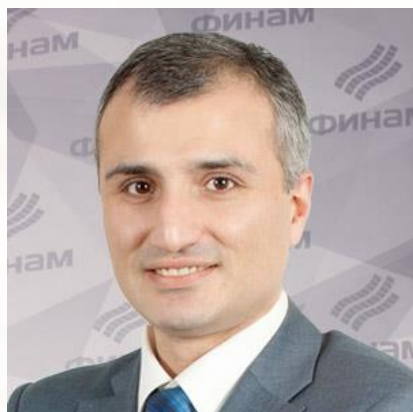
Арсен Айвазов Генеральный директор АО «ФИНАМ»